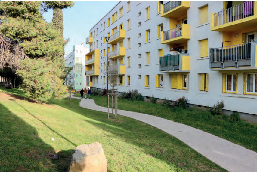
La Conte. Au pied de l'immeuble Bourgogne l'aménagement d'une coulée verte offre une promenade agréable aux piétons.