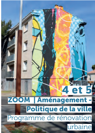
4 et 5 ZOOM | Aménagement - Politique de la ville Programme de rénovation urbaine