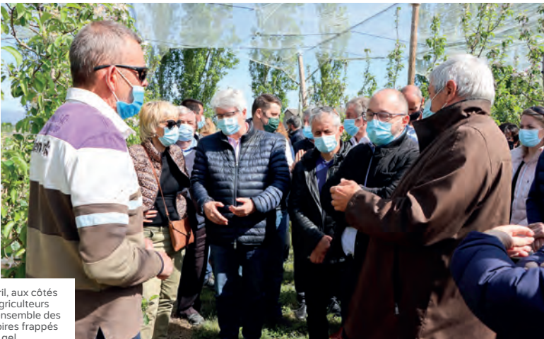
En avril, aux côtés des agriculteurs sur l'ensemble des territoires frappés par le gel.