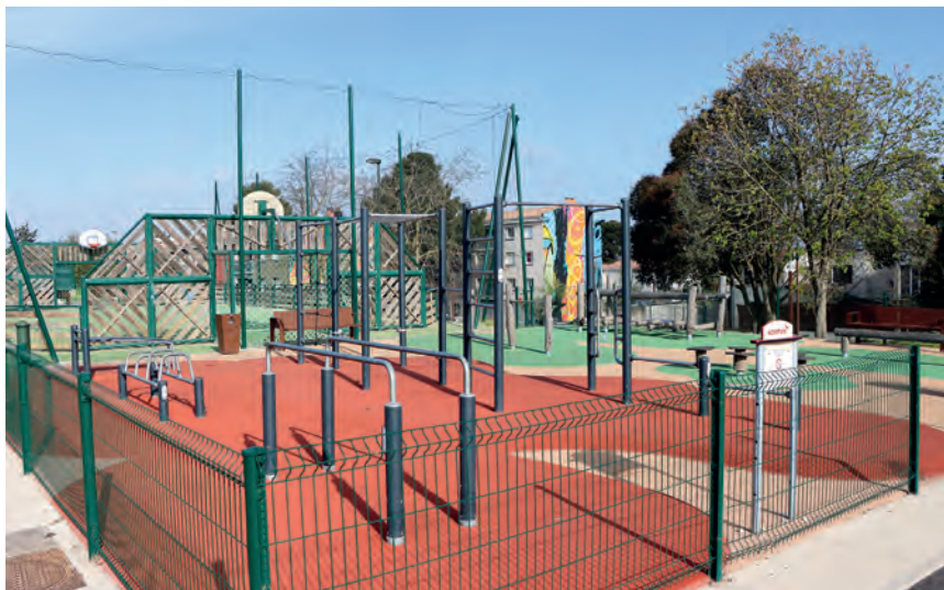
Ozanam. Demandé par les habitants, un espace de jeux a été aménagé, et des places de stationnements réorganisées à proximité.