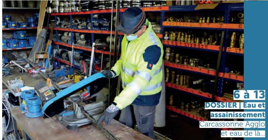
6 à 13 DOSSIER | Eau et assainissement Carcassonne Agglo et eau de là...