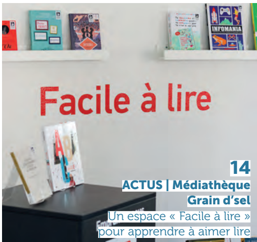
14 ACTUS | Médiathèque Grain d'sel Un espace « Facile à lire » pour apprendre à aimer lire