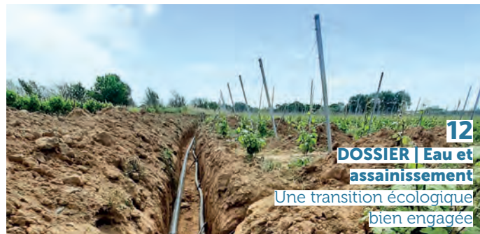
12 DOSSIER | Eau et assainissement Une transition écologique bien engagée