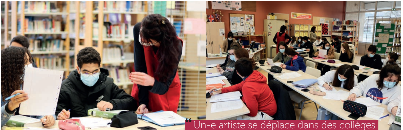
Un-e artiste se déplace dans des collèges à la rencontre des élèves de troisième