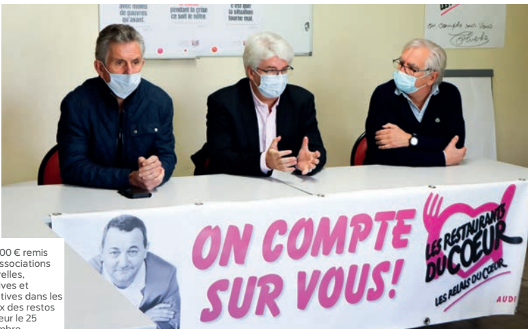
100 000 € remis aux associations culturelles, sportives et caritatives dans les locaux des restos du cœur le 25 novembre.