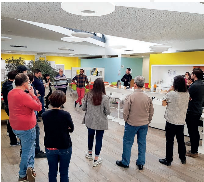
Des moments de convivialité sont régulièrement organisés pour alimenter le réseau.