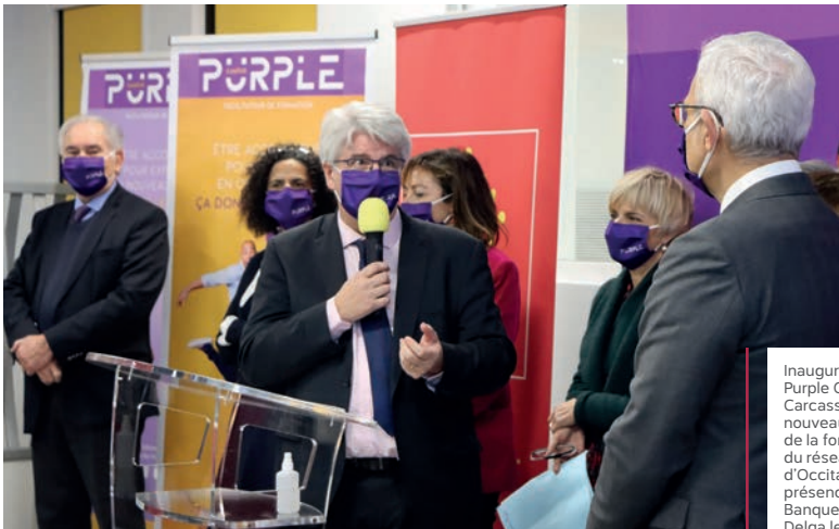
Inauguration de Purple Campus Carcassonne, nouveau campus de la formation du réseau des CCI d'Occitanie, en présence de Régis Banquet, Carole Delga le 7 janvier.

Au-delà des communes, nous n'oublions pas les citoyens, les acteurs locaux et nos agents qui participeront à la construction de ce projet de territoire. Ancrée dans son environnement, Carcassonne Agglo construit aujourd'hui un territoire de confiance.